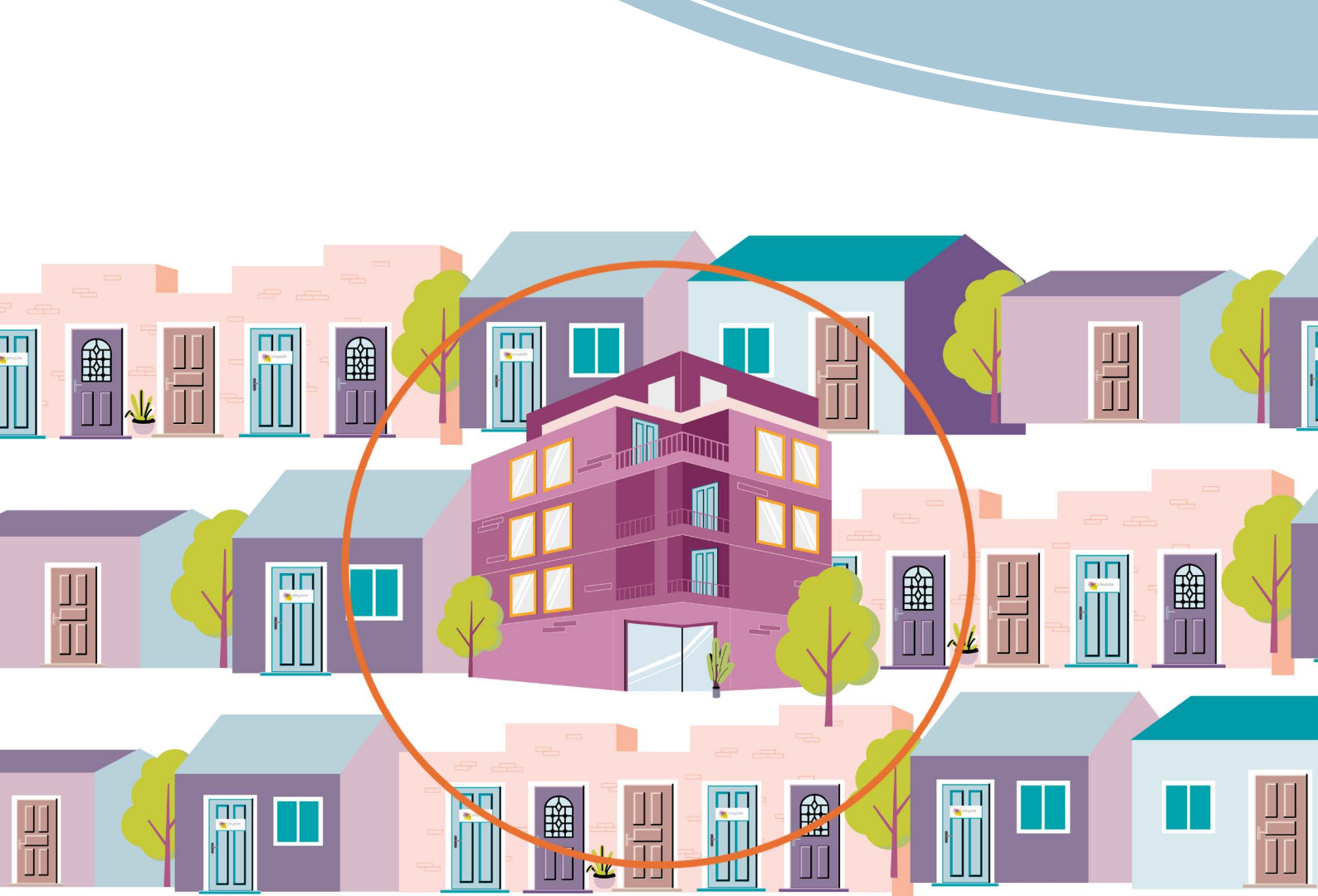
Afbeelding 3: De Pleyade locatie als integraal onderdeel van de buurt

In onze manier van werken blijven ouderen voor zichzelf zorgen door deze taak te delen met hun netwerk, de buurt en zorgprofessionals. Dit stelt zorgprofessionals in staat meer ouderen te helpen met persoonlijke aandacht en zorg die passend is, in plaats van standaardoplossingen. Bij Pleyade staan we naast ouderen en helpen we hen om het leven te blijven leiden zoals zij dat willen. Om dit te kunnen doen moeten we geen zorg leveren met het zorgsysteem als uitgangspunt, maar echt de behoefte en wensen van de ouderen.